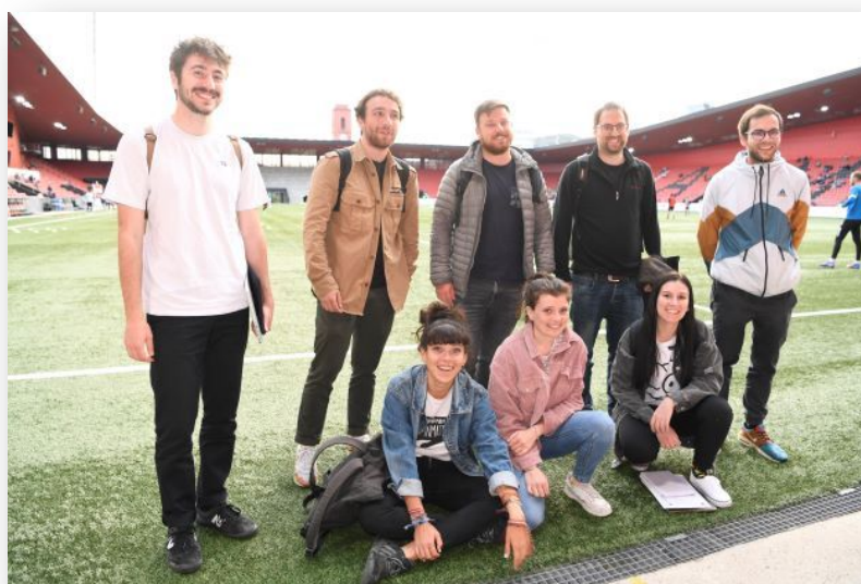
Les candidates et candidats « presse écrite » 2022 sur la pelouse du stade de la Maladière, à Neuchâtel.

Ce projet s'inscrit dans le prolongement des éditions menées en 2022 et 2023, à l'occasion de rencontres du NE Xamax FCS, du HC La Chaux-de-Fonds, deux exercices couronnés de succès.