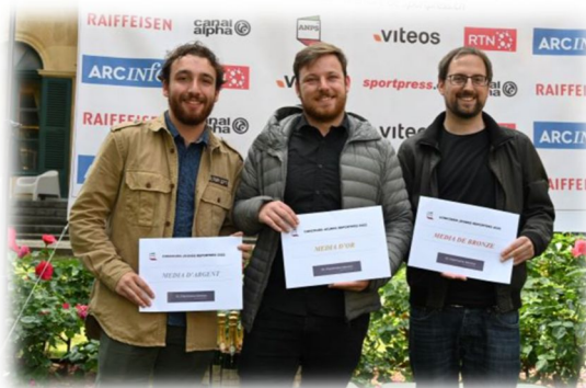
Le travail en salle de presse et le podium du concours 2022 !