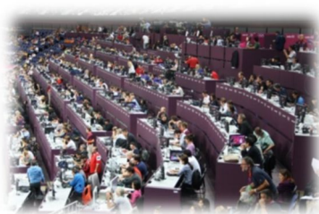
1. Presse écrite.

Le thème du concours de l'ANPS se décline en quatre expériences dans les domaines spécifiques du reportage, soit l'écrit, la photographie, le commentaire (radio & télévision) et le digital (photo, JRI & Internet).