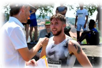
3. Radio & Télévision.